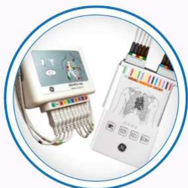
GEH-ECG-1200 & CAM Connect 14 acquisition modules

Беспроводная регистрация (с дополнительным GEH-ECG-1200) устраняет необходимость в громоздких проводах, поэтому пациенты могут свободно двигаться во время тестирования. CardioSoft Client, добавленный к сетевому ПК, создает мультимодальную рабочую станцию для кардиологического обзора.